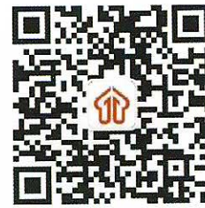
关注“昆明就业直通车”二维码