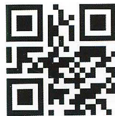
“昆明就业服务网”二维码